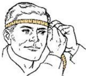
Tabela de medidas